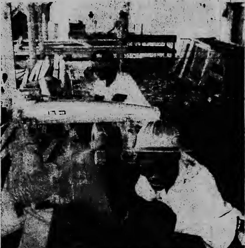
Ya cu ha cierto punto nan a cuminsa caba cu bashamentu di e fundeshi, den winkel di carpinte nan ta trahando duro pa prepara e fihshinan pa beton.